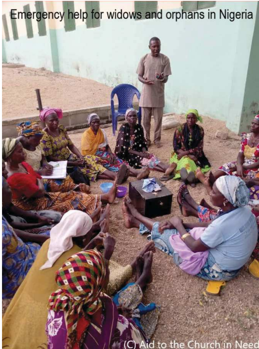
Foto: Humanitární pomoc vdovám a sirotkům v Nigérii