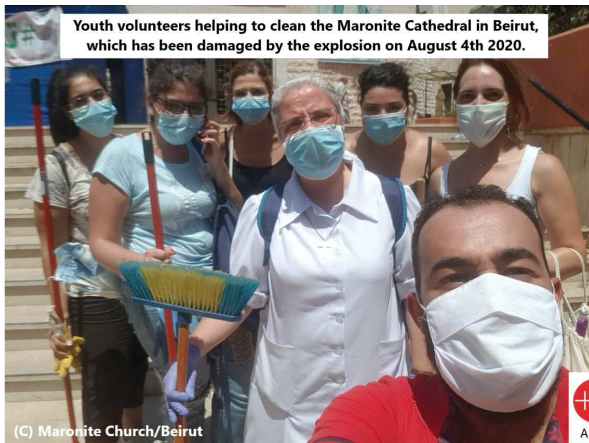
Foto: Mladí dobrovolníci pomáhají vyklidit maronitskou katedrálu v Bejrútu, poškozenou výbuchem 4. srpna 2020